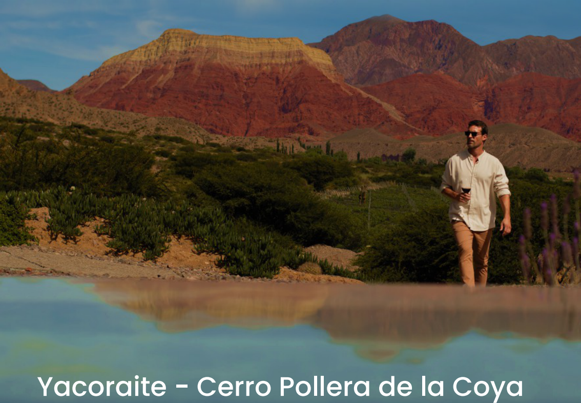
Yacoraite - Cerro Pollera de la Coya